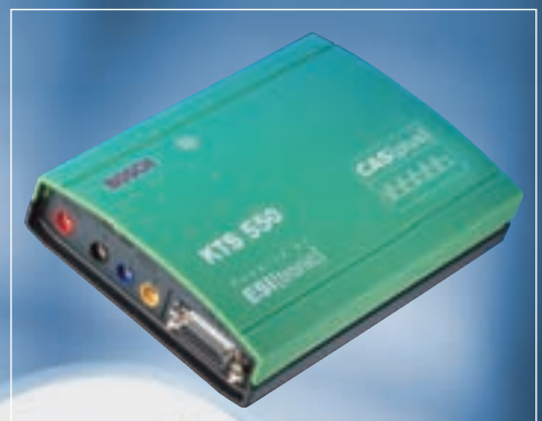
Системный диагностический модуль KTS — экономичное решение, позволяющее превратить компьютер в полноценный сканер.