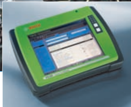
Новый флагманский прибор KTS 670 адресован тем, кто нацелен использовать самое передовое, высокотехнологичное оборудование.

Как и приборы предыдущего поколения, сканеры моделей KTS 520/550 и KTS 650 использовали единую программную платформу — ES[tronic]. На тот период времени диагностический раздел содержал программы для работы с 2300 системами автомобилей 100 автопроизводителей. Поначалу связь с бортовой электроникой осуществлялась по протоколам ISO/SAE. К 2005 году на вторичном рынке стали массово появляться автомобили с мультиплексной электропроводкой. В ответ на это сканеры KTS немедленно получили возможность работать по