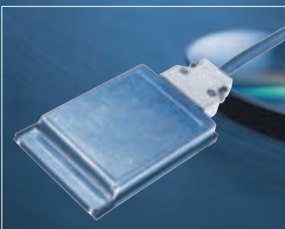
KTS-карта, прародитель диагностических модулей.