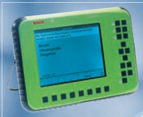
KTS 500 установил стандарты линейки сканеров-компьютеров Bosch: мощный процессор, емкий жесткий диск, большой экран и развитые коммуникационные возможности.