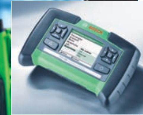
KTS 200 — отличный вариант для желающих приобрести недорогой сканер в традиционном исполнении.

Для полноты картины можно также упомянуть, что наряду со сканерами «пятеркой» серии выпускались приборы KTS 100, опять-таки