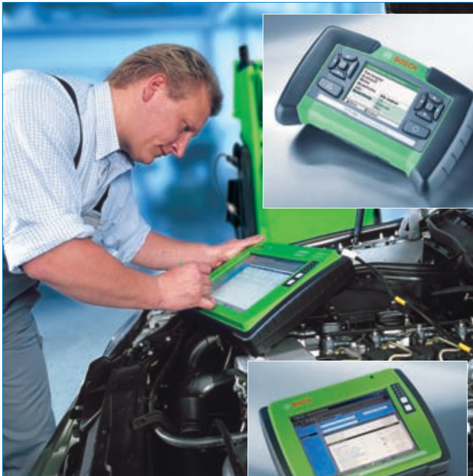
Дополнительные функции двухканального мультиметра и осциллографа превратили мультимедийный тестер KTS 650 в универсальный диагностический инструмент.

ции по поиску неисправностей. Диагностические разделы программно увязаны воедино системой CAS, что позволяет сделать процесс диагностики автомобиля «компьютерно ориентированным». Например, после идентификации автомобиля программа автоматически загрузит необходимые информационные блоки. Одним нажатием кнопки диагност получит сведения о применяющихся на автомобиле системах управления, их структуре и компонентах. При обнаружении ошибки программа опять же автоматически предоставит диагносту расшифровку кодов, а также поэтапный алгоритм поиска неисправности. На этапе проверки параметров электрических сигналов система сравнит фактическую величину с нормативом и сохранит данные в памяти. Таким образом, система CAS экономит время диагноста и направляет его действия для гарантированного обнаружения дефекта. Компьютерная поддержка процесса диагностики была и до сих пор остается выдающимся преимуществом сканеров KTS перед приборами-конкурентами.