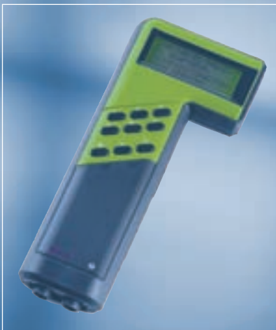
KTS 300 — первенец семейства сканеров Bosch и одновременно долгожитель рынка.

начально на CD-, а впоследствии на DVD-дисках), имеет модульную структуру. Одним из ее многочисленных «кубиков» является диагностический модуль, который записан на отдельном диске. С него информация загружалась на жесткий диск KTS 500 или в память компьютера в случае использования KTS-карты. Модуль диагностики состоит из двух разделов: SD и SIS. Первый содержит программы для проверки блоков управления, второй — алгоритмы и инструк-