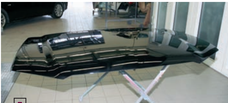
Нанесение керамического лака Mightylac New Ceramic Clear взамен обычного позволило повысить эксплуатационную стойкость покрытия капота и улучшило его внешний вид.