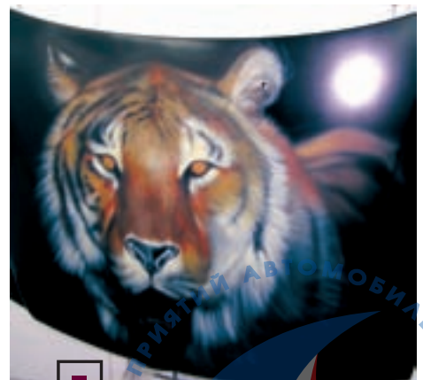
Защита аэрографии — еще одна область применения керамического лака.

Благодарим технических экспертов Business Car Refinish и сотрудников кузовного цеха ТЦ «Лексус Каширский» за помощь в подготовке данной статьи.