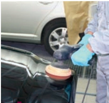
После сушки покрытие полируется, как и в предыдущем случае.