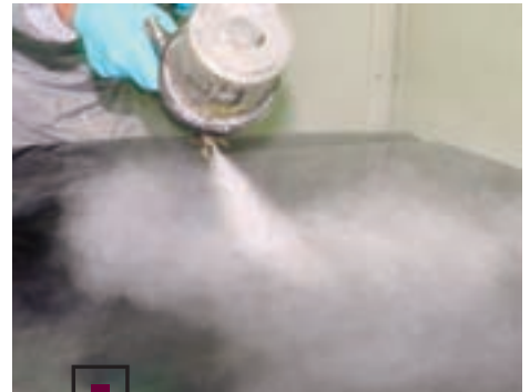
Лак смешивается с отвердителем в пропорции 2:1. В смесь добавляется 20% стандартного разбавителя пах Admila 500 Thinner. На капот наносятся три слоя лака «мокрым по мокрому» с промежуточной сушкой 5–7 мин.