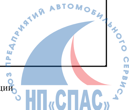
Рисунок Б.2 - Образец углового бланка письма организации