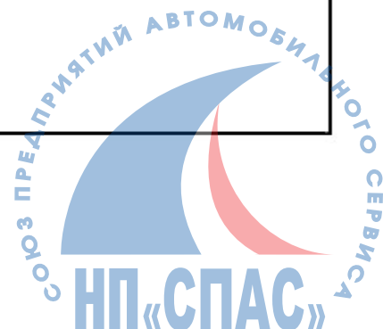
Рисунок Б.1 - Образец общего бланка организации