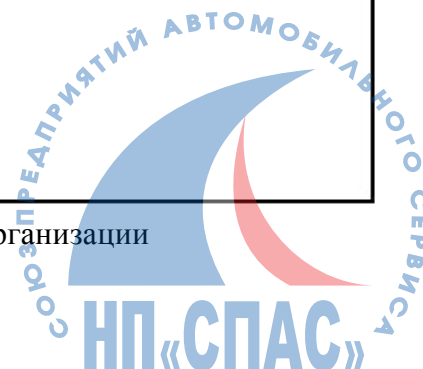
Рисунок Б.5 - Образец бланка конкретного вида документа организации