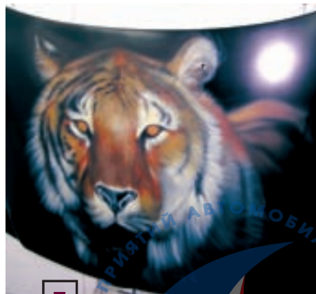
□ Защита аэрографии — еще одна область применения керамического лака.

Благодарим технических экспертов Business Car Refinish и сотрудников кузовного цеха ТЦ «Лексус Каширский» за помощь в подготовке данной статьи.