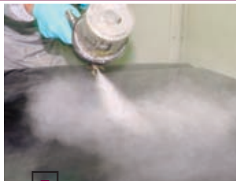
□ Лак смешивается с отвердителем в пропорции 2:1. В смесь добавляется 20% стандартного разбавителя пах Admila 500 Thinner. На капот наносятся три слоя лака «мокрым по мокрому» с промежуточной сушкой 5–7 мин.