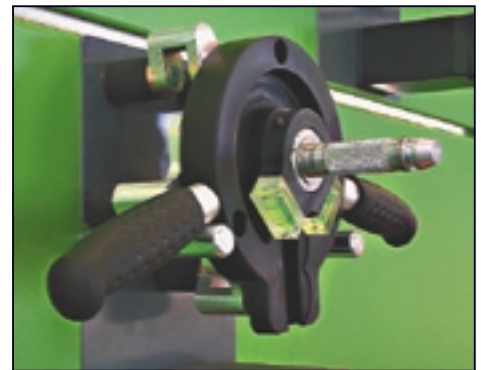
«Время — деньги». Следуя этому девизу, Bosch разработал и запатентовал магнитную систему крепления измерительной головки к колесу.

Время — деньги. Этот постулат принят за аксиому многими современными СТОА, предъявляющими повышенные требования к производительности оборудования, в том числе для диагностики геометрии колес автомобиля. Разработчики Bosch, четко уловив создавшуюся тенденцию,