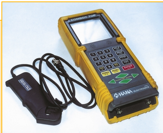
«Очень хороший» сканер, произведенный в Корее, позволяющий диагностировать АКПП практически всех корейских автомобилей.

Дилерский сканер Hi-scan , которым оснащаются сервисные станции Hyundai . При доукомплектовании дополнительными картриджами позволяет работать с Daewoo, KIA, Ssang Yong . На рынке его можно приобрести примерно за 3 000 долларов.