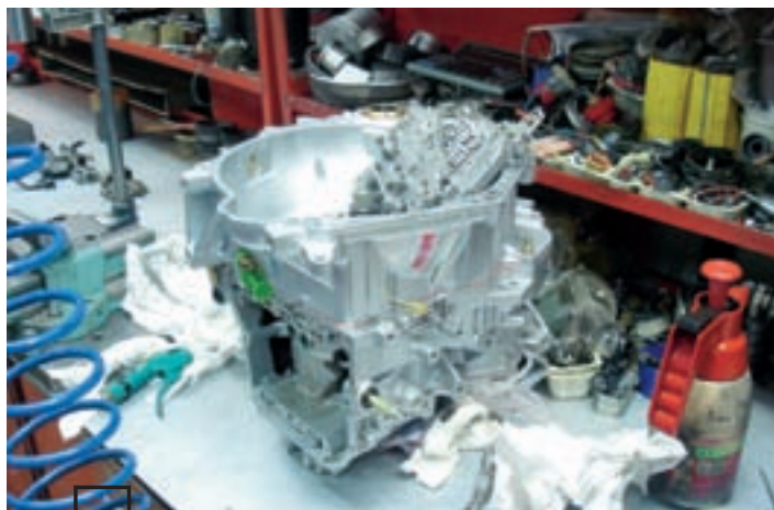
...до блеска. В таком виде отремонтированную коробку ставят на автомобиль.

вопросы, основанные не на реальном опыте эксплуатации «автомата», а слухах и мифах, часто высосанных из пальца. И для многих клиентов становится открытием, что ответы на некоторые их вопросы уже прописаны в инструкции к автомобилю, например правила буксировки.