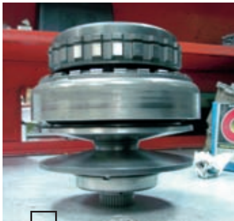
Шкив вариатора. На данный момент в российском автопарке вариаторов на порядок меньше, чем гидравлических «автоматов».

Что касается надежности, разницы между этими двумя схемами нет. Если судить по количеству автомобилей, поступающих в ремонт, то соотношение обоих типов трансмиссий приблизительно соответствует их отношению на рынке — доля ремонтируемых вариаторов приблизительно равна 5%. Заниматься ли сервису ремонтом вариаторов или оставить это «на откуп» другим фирмам — личное дело каждого.