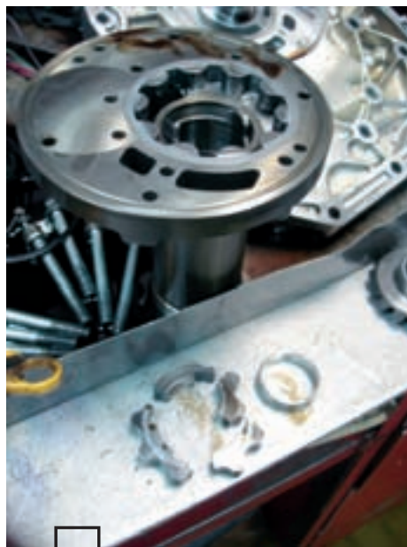
Развалившийся маслонасос. Возможно, дефектная партия.

Самое правильное — иметь склад запасных частей для наиболее востребованных деталей. Хотя, в свою очередь, это требует немаленьких капиталовложений. И будьте уверены — наступит момент, когда понадобится деталь, которую