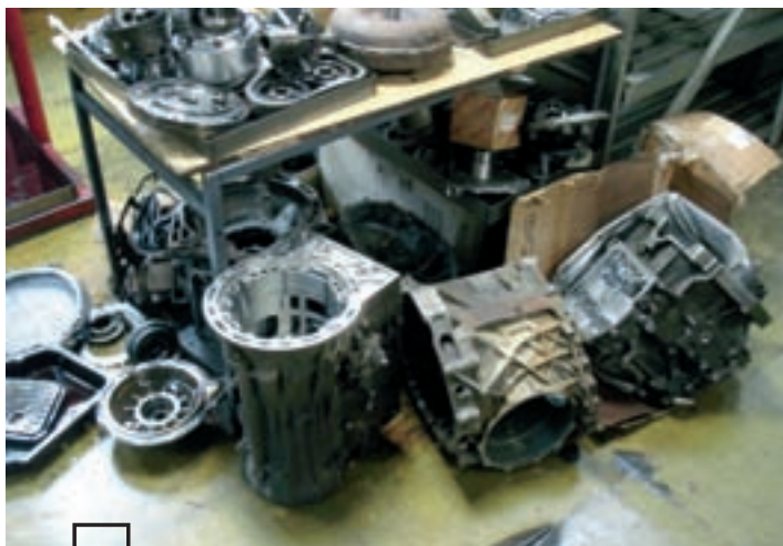
Перед ремонтом коробки тщательно моются...